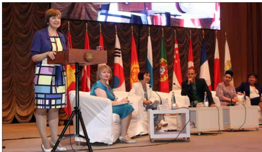
Выступления на Форуме социальных работников в Ульяновске