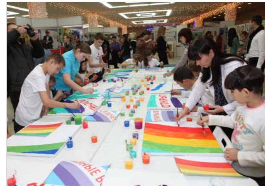
III Международный социально-образовательный Форум «Социальная сплоченность. Открытое общество. Равные возможности»

До настоящего времени в мире отсутствует общепринятое определение социальной сплоченности, хотя сам термин был запущен в широкий оборот Организацией Объединенных Наций еще во второй половине 1940-х годов. Существует некое общее понимание, что в данном случае речь идет о состоянии общества, сплоченном общими ценностями и узами солидарности. В таком обществе отнюдь не исключаются социальные различия и противоречия, однако здесь не допускается слишком большого разрыва между богатыми и остальными слоями населения, а различия и противоречия не перерастают в социальные антагонизмы и потрясения.