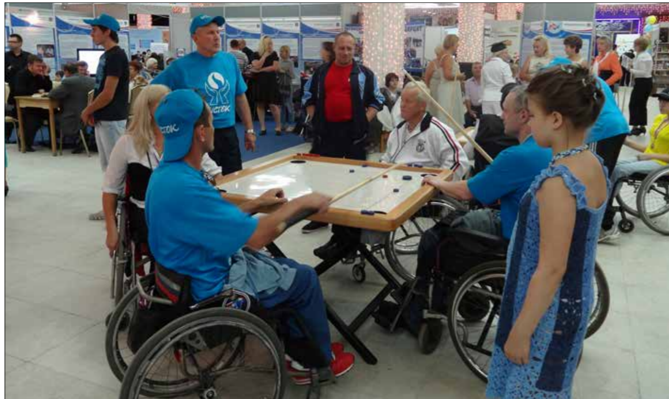
II Международный форум социальных работников, 2013 год