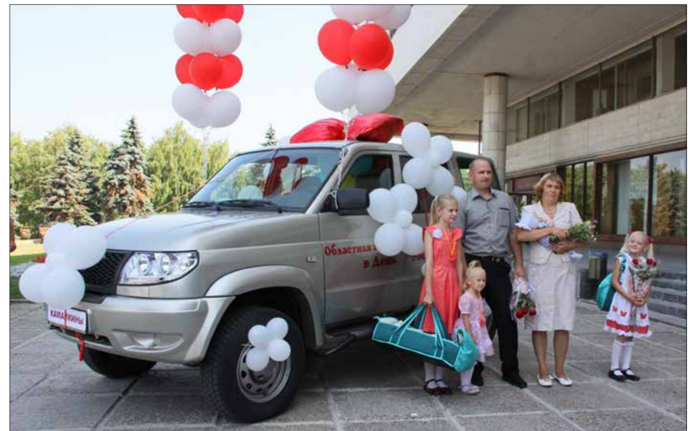
Управление социального обеспечения и защиты Ульяновской области